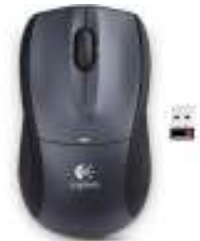
Vezeték nélküli egér