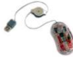
USB porton csatlakoztatható optikai egér